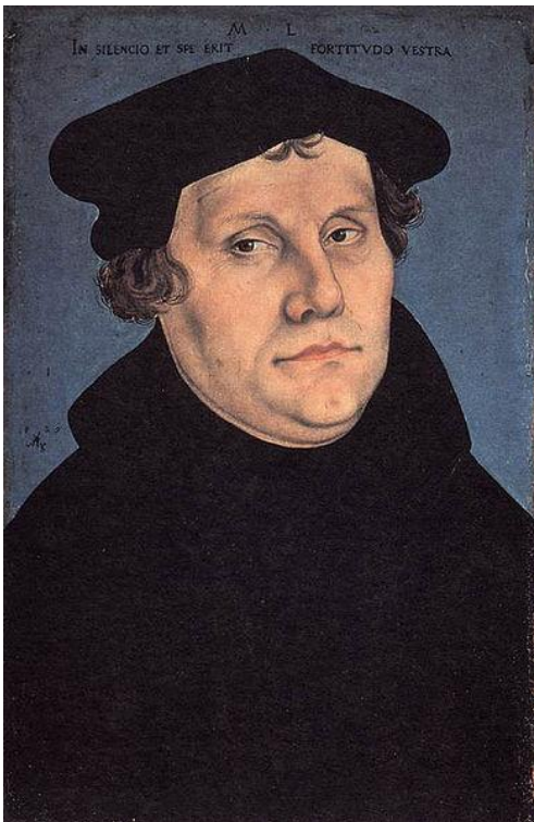
Obr 1. – Martin Luther