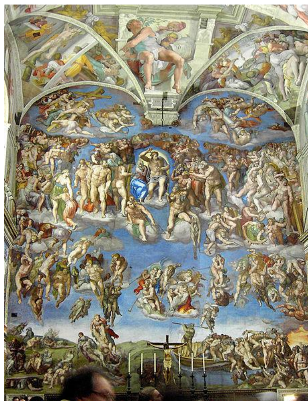
Obr. 2 - Michelangelo Buonarroti