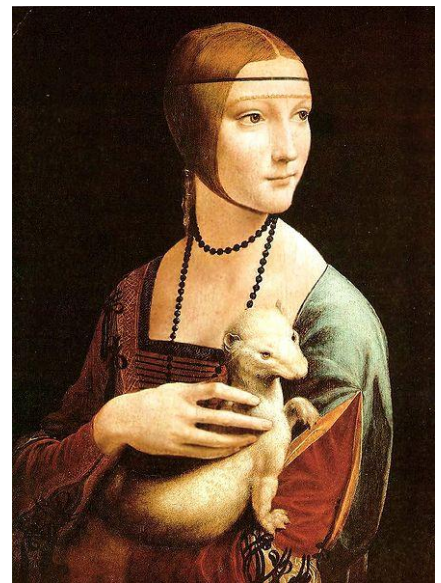
Obr. 6- Leonardo da Vinci