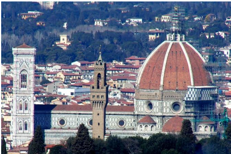
Obr. 5 - Michelangelo Buonarroti