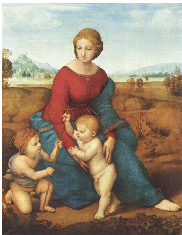
Obr. 1 - Rafael Santi