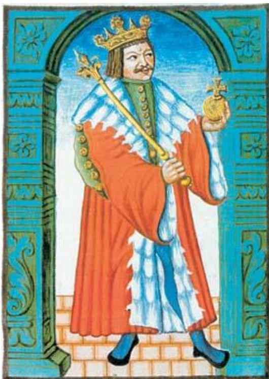
Obr. 1 – Jiří z Poděbrad