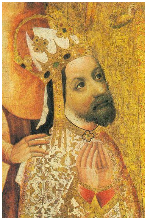
Obr. 2 – Karel IV.