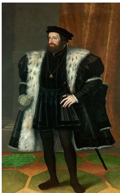
Obr. 3 – Ferdinand I. Habsburský