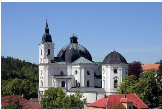
Kostel Jména Panny Marie od J. B. Santiniho