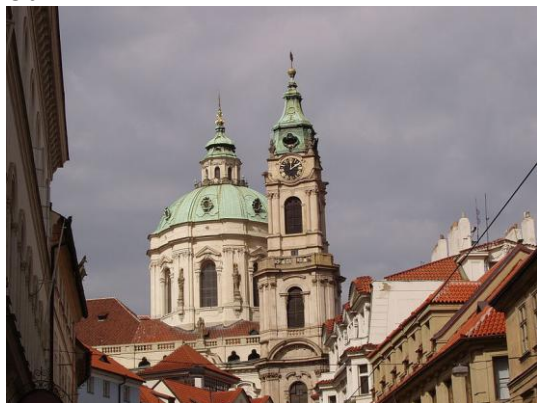
Kostel svatého Mikuláše v Praze od Kryštofa a Kiliána Ignáce Dientzenhoferů